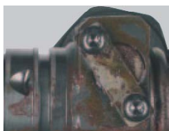
Fuerte corrosión o deterioro evidente.