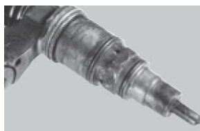
Daños en la carcasa o en la superficie de sellado o desperfectos causados por golpes.