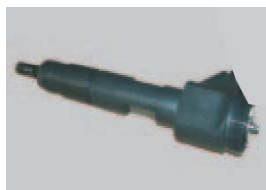
Falta de piezas o componentes del inyector