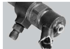
Daños en conexiones eléctricas.