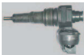
Falta de piezas o componentes del inyector o unidad-bomba.