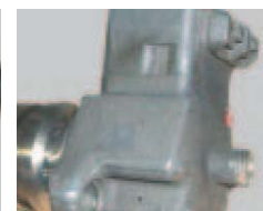
Daños en conexiones eléctricas o de alta presión.