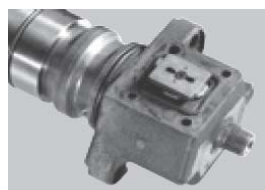
Falta de piezas o componentes del inyector o unidad-bomba