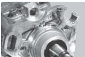
Daños desperfectos o roturas causadas por golpes.