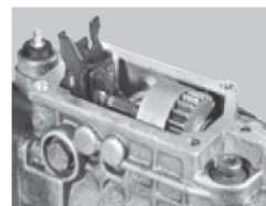
Bomba desmontada o incompleta.