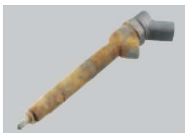
Fuerte corrosión o deterioro evidente.