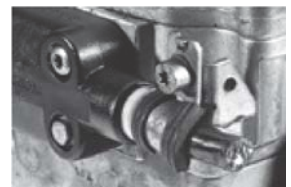
Cables dañados o cortados en sus componentes eléctricos.