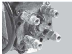
Fuerte corrosión o deterioro evidente.