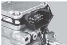
Daños en los conectores.