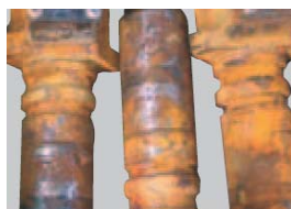
Fuerte corrosión o deterioro evidente.