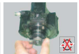
Árbol excéntrico bloqueado.