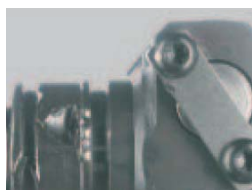
Daños en el cuerpo o en las superficies de sellado.