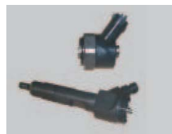
Inyector desmontado o incompleto.