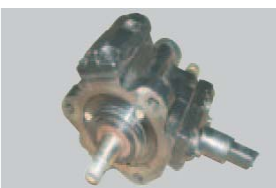
Daños en la brida de accionamiento o carcasa.