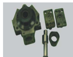
Bomba desmontada o incompleta.