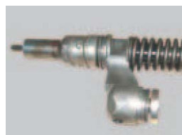
Inyector o unidad-bomba desmontado o incompleto.