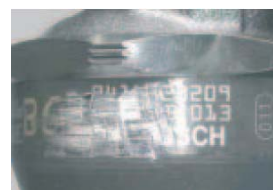
Número de referencia ilegible o desperfectos causados por golpes.