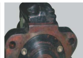
Fuerte corrosión o deterioro evidente.