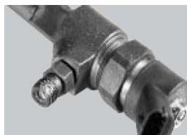
Daños en la carcasa o en la superficie de sellado o desperfectos causados por golpes.