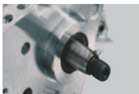
Daños en el árbol de accionamiento o desperfectos causadas por golpes.